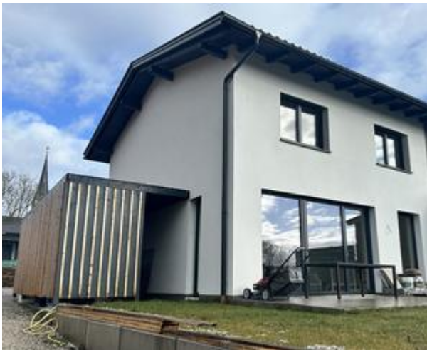
Ansicht vom Garten