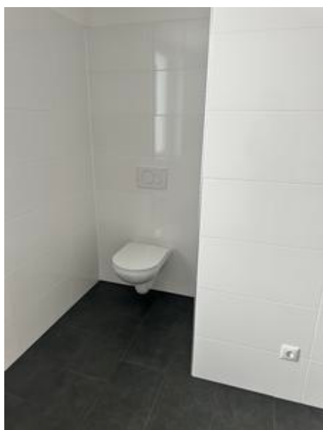
WC im Bad