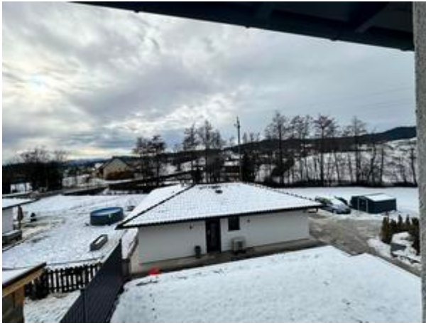
Aussicht aus dem Kinderzimmer