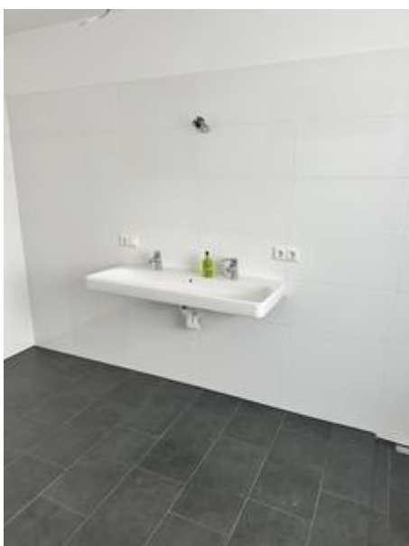
Waschbecken im Badezimmer