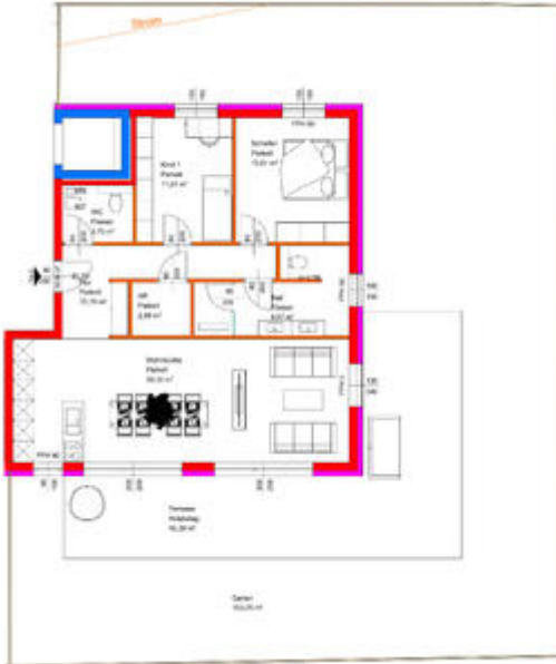
Grundriss Top 2