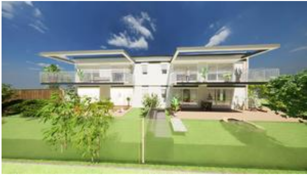
Wohnhaus vom Garten